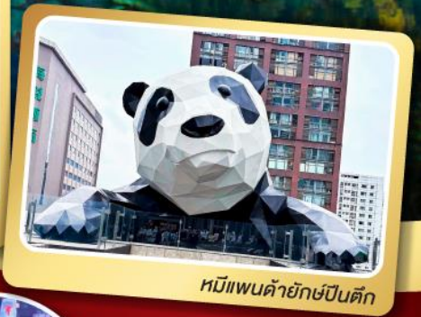
หมีแพนด้ายักษ์ปักกิ่ง

* พักโรงแรม 4-5 ดาว * รวมวีซ่ากรุป * เที่ยวอย่างเต็มอิ่ม..ไม่หลงร้านรัฐบาล